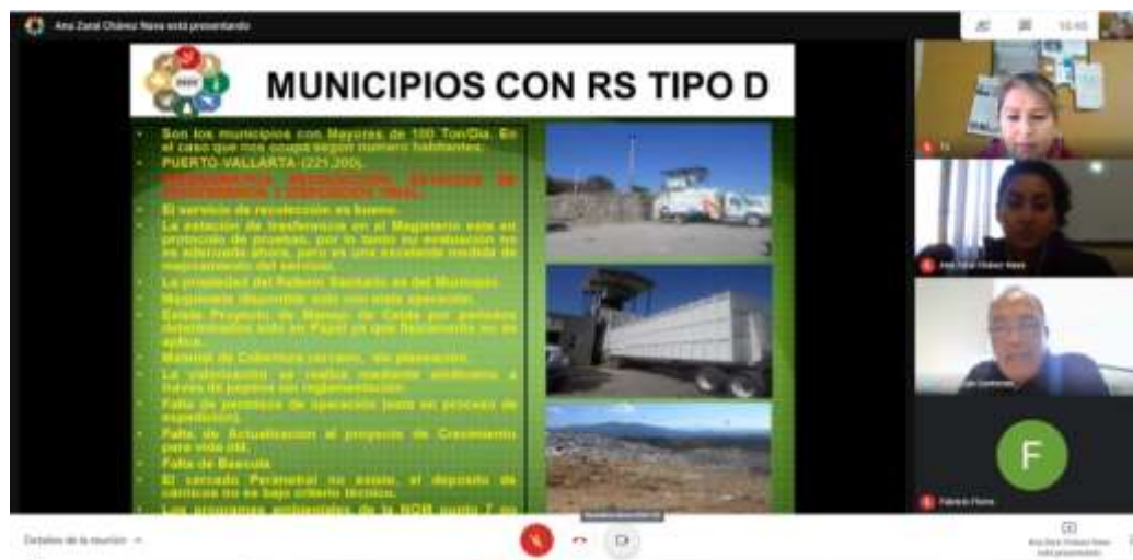
Presentación virtual de diagnóstico

El día 26 de enero, se llevó a cabo una reunión virtual para presentación de informe del diagnóstico del manejo de residuos en los municipios de la JISOC en la que participaron el director general, coordinadora de planeación, coordinadora de residuos de la JISOC y asesor externo, quien expuso los resultados y conclusiones obtenidos por cada municipio y de acuerdo a cada etapa en el manejo de residuos, así como la problemática identificada y posibles soluciones, enfatizando las acciones prioritarias para seguir garantizando una correcta disposición de los residuos sólidos urbanos y, a la vez, optimizar recursos.